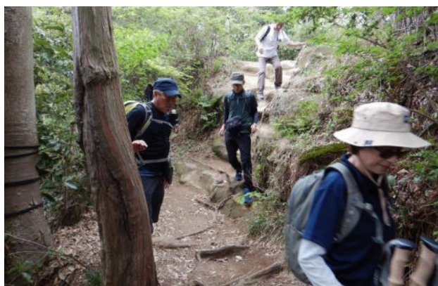
急登の山登りを超えて一息