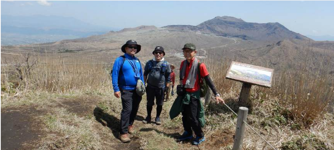
ひのくに橋を渡ればシェルターが周辺に建ちならぶ阿蘇火口