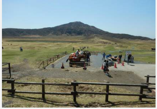
烏帽子岳1337m(60分、標高差200m)