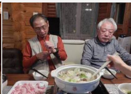
鍋の後は、アプリカラオケで大盛り上がり 最初の曲は ブルーライトヨコハマ 街の灯りがとてもきれいね