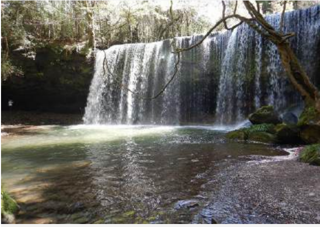
滝の大きさ:幅20m高さ10m