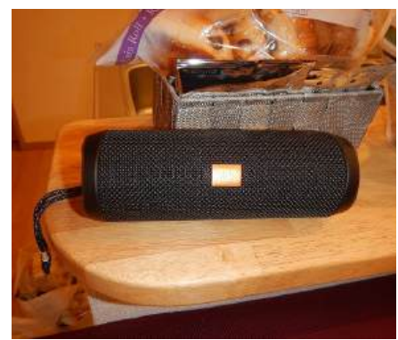
JBL Bluetoothスピーカー2本 最強ステレオサウンド！ 19時～25時まで6時間の大盛況 翌朝 超眠いzzz