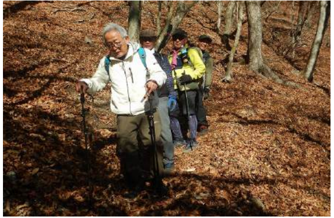
普段から口を滑らせ危うい立場のお父さん 足を滑らせスッテンコロリンはせず 無事下山 拍手!