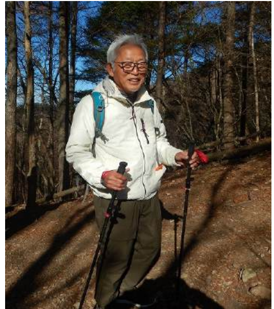
アルファロメオ秋葉号で大月駅まで戻りました ○のおじさん 風邪で欠席の卒業写真ではありません