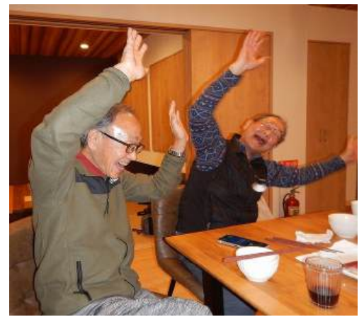
スポティファイ カラオケ スマホ片手にチークタイム ミラーボール回るスナックと化し 高齢者 踊る！