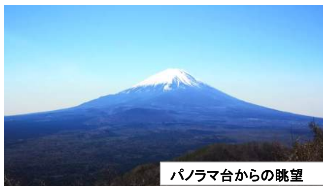
パノラマ台からの眺望