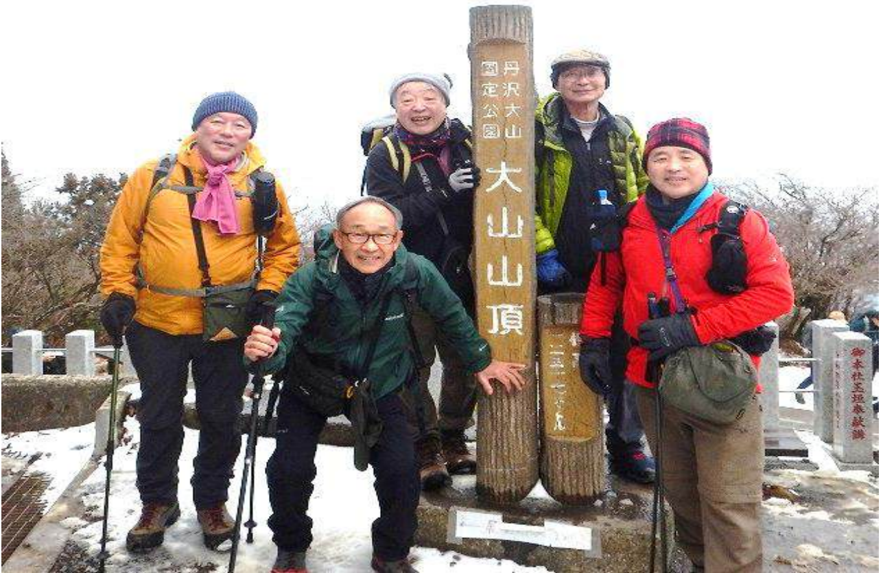
人間丸くならず『★ほしになれ』とばかりに何やら鎮座しております